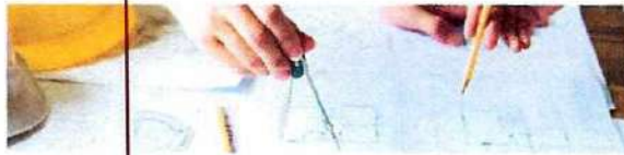
3 INFORME DEL PROGRAMA ANUAL DE DESARROLLO ARCHIVÍSTICO DE LA SECRETARÍA DEL CAMPO 2022